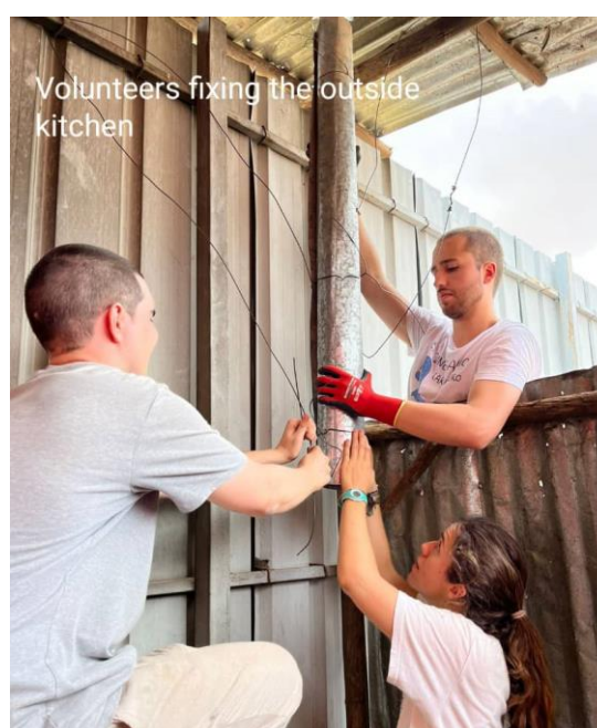
Wolontariusze montujący w misji kuchnię na zewnątrz