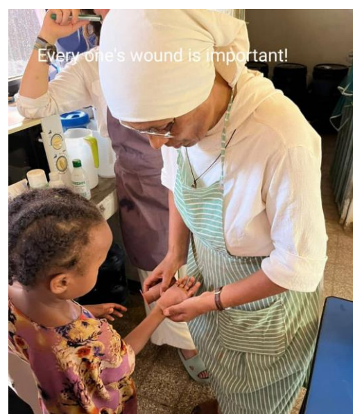
Każda rana i zranienie jest ważne 😊