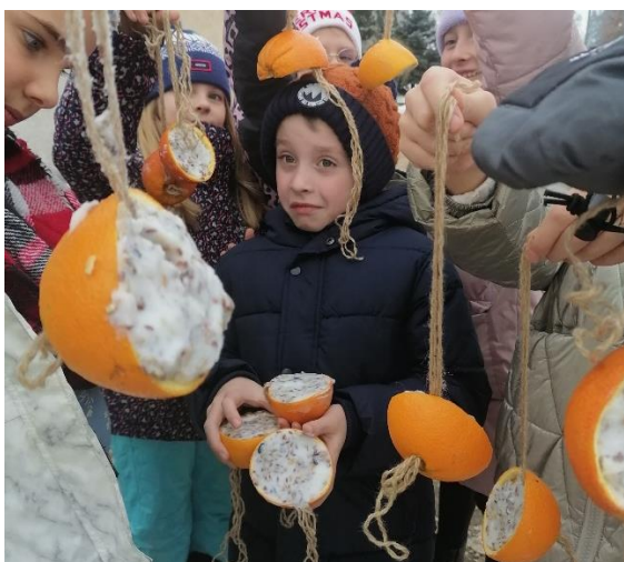
Dzieci z klasy 2c

Za nami jest już zbiórka orzechów dla niedźwiedzi. Zorganizowaliśmy wspólnie z koleżankami i kolegami z klasy III a głosowanie na najbardziej niezwykłe zwierzęta, a teraz dokarmiamy ptaki. Okres zimy to trudny czas dla naszych śpiewających przyjaciół. Jeśli chcemy mieć ich blisko siebie i cieszyć się ich bliskością, a w okresie wiosny i lata wsłuchiwać się w cudne ptasie trele to pomóżmy im. Przygotowaliśmy przysmaki i rozwiesiliśmy je w lasku tuż za płotem naszego boiska. Wsypaliśmy ziarno do karmników.